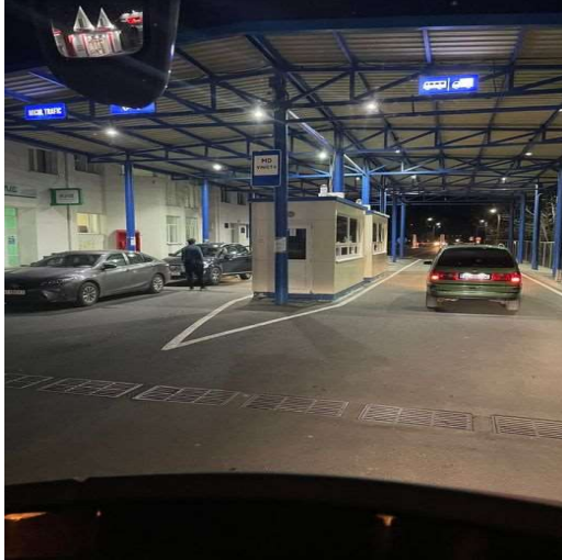
Die Grenze nach Moldavien- der vierte Grenzübertritt